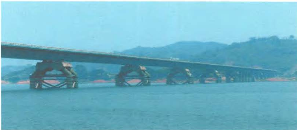
Puente Chiapas, Autopista Las Choapas-Ocozocoautla